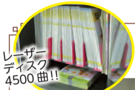
レーザーディスク 4500曲!!