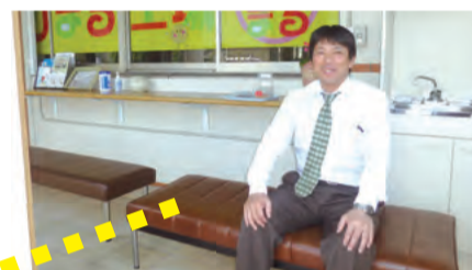
写真は地域交流スペースの全景と成瀬施設長