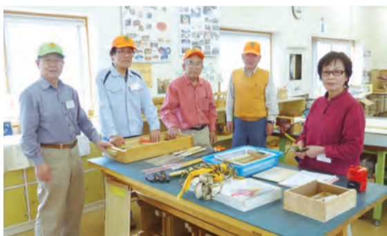
写真はスタッフのみなさん