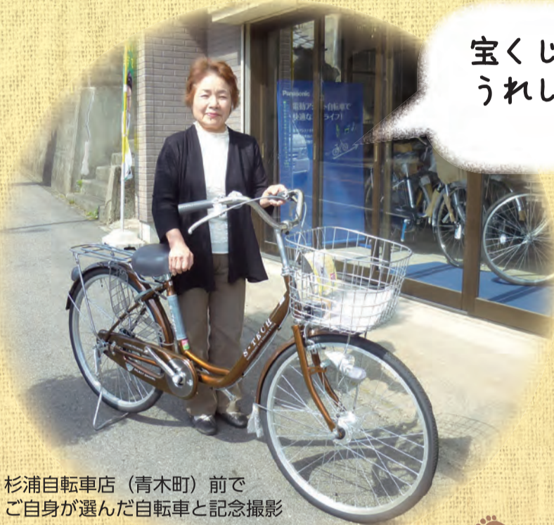
杉浦自転車店（青木町）前で ご自身が選んだ自転車と記念撮影